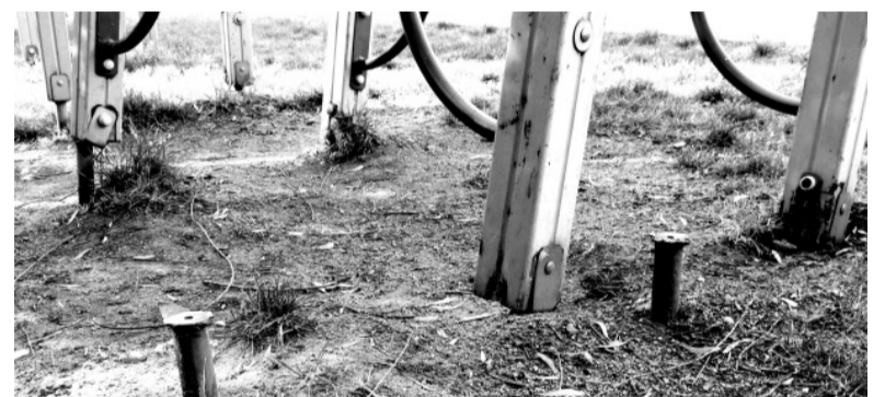
Сорванные и смещенные на полметра от креплений стойки игровой конструкции, по которой до сих пор лазит отчаянная детвора.