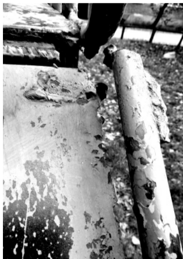
Фрагмент обычной горки. Если при спуске в отверстие рваного металла попадет ладошка или детская ручонка, их просто разорвёт.